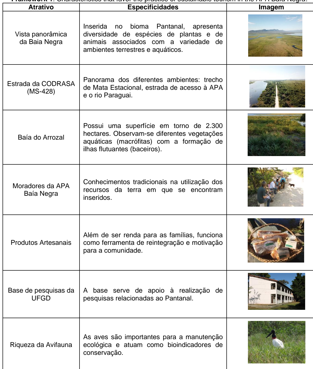
Quadro 1: Características que favorecem à prática do turismo sustentável na APA Baía Negra. Framework 1: Characteristics that favor the practice of sustainable tourism in the APA Baía Negra.